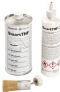
WELD, Flasche + Pinsel